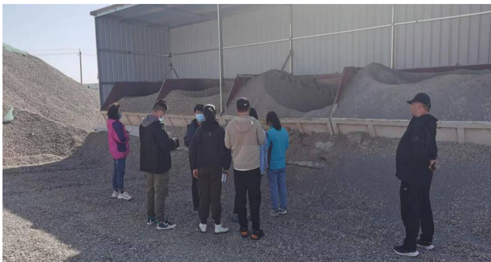
工贸企业现场调查： 商砧站现场调查、 工艺流程讲解