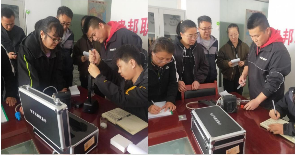
图为外检部使用 ZM-103B 电子皂膜流量计对 DW-18C 智能个体粉尘采样器进行流量校准工作。