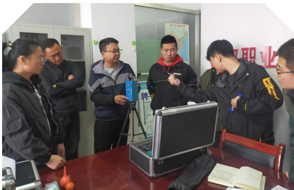
检测部张部长亲自讲解 QC-4S 防爆大气采样器的性能、结构、使用方法、注意事项等内容